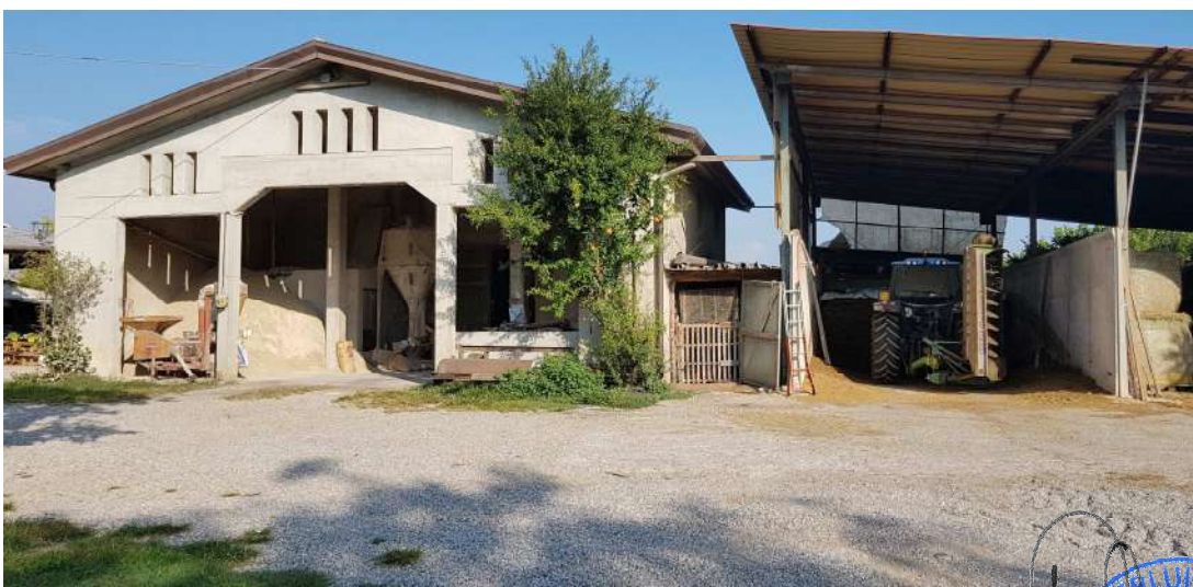
Fabbricato B e adiacente fabbricato C - piano terra lato sud