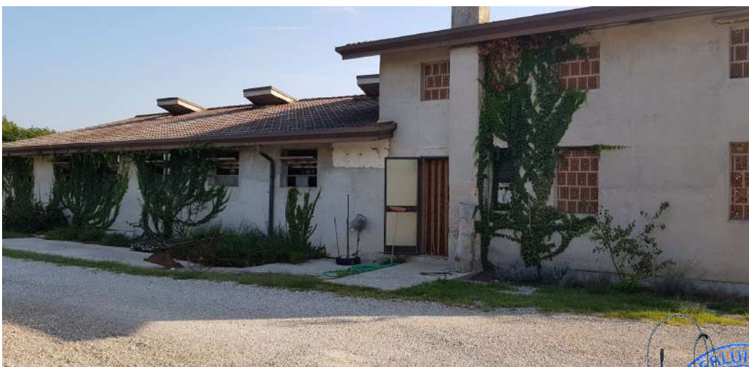
Fabbricato B - lato ovest