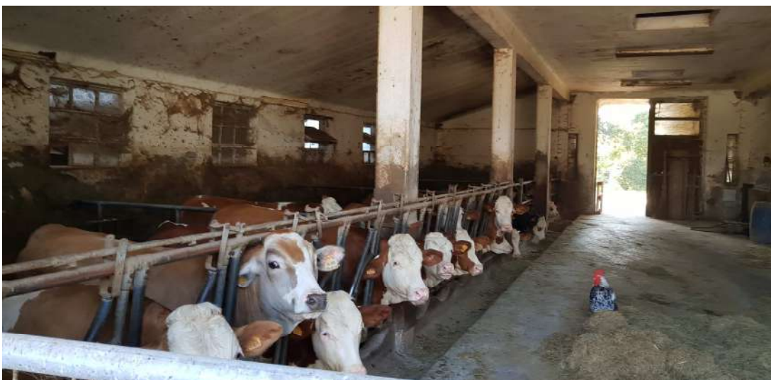
Fabbricato B - piano terra