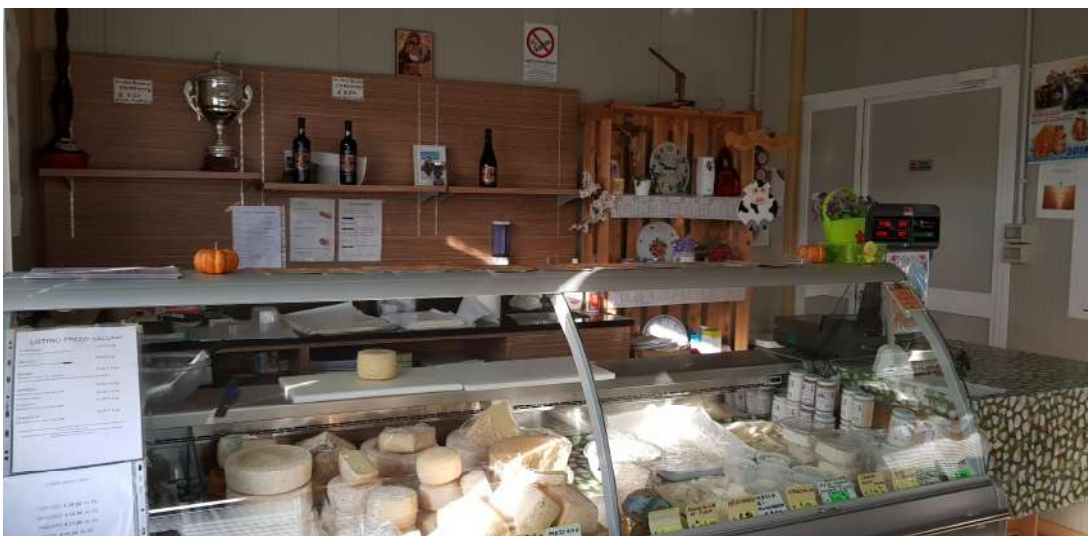
Fabbricato D - rivendita prodotti piano terra