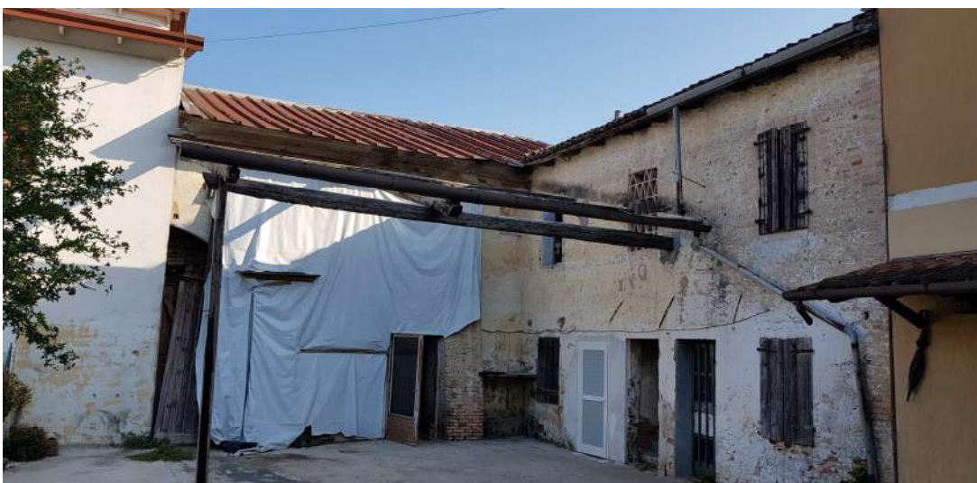
Fabbricato A - lato sud abitazione residenziale