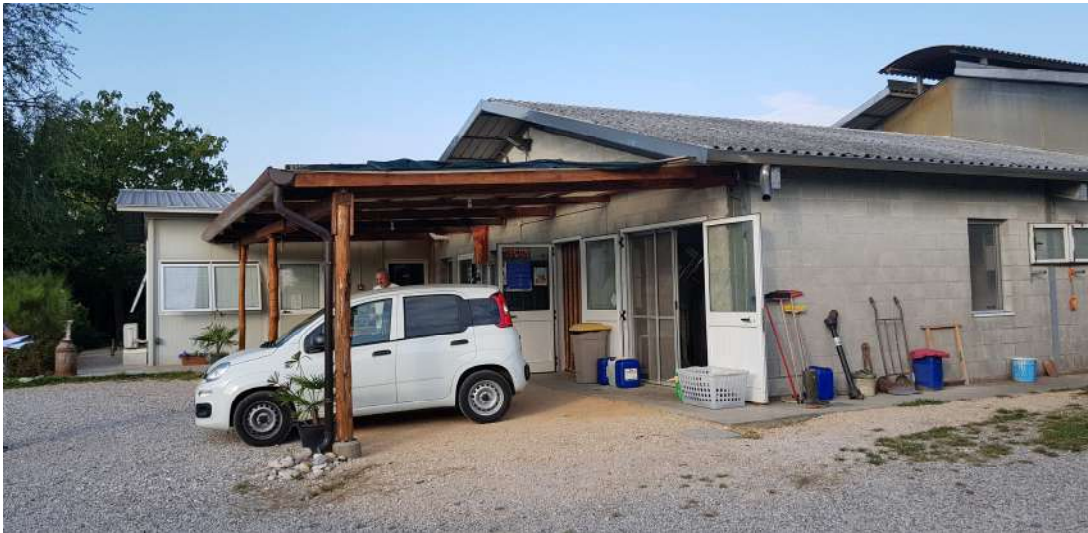
Fabbricato D - ingresso minicaseificio e locali accessori lato sud/est