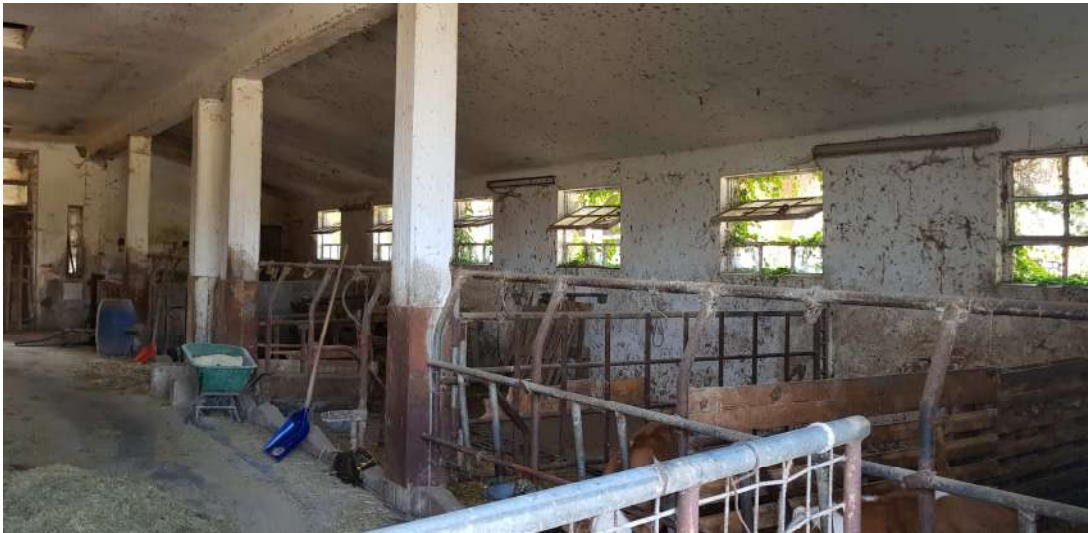
Fabbricato B - piano terra