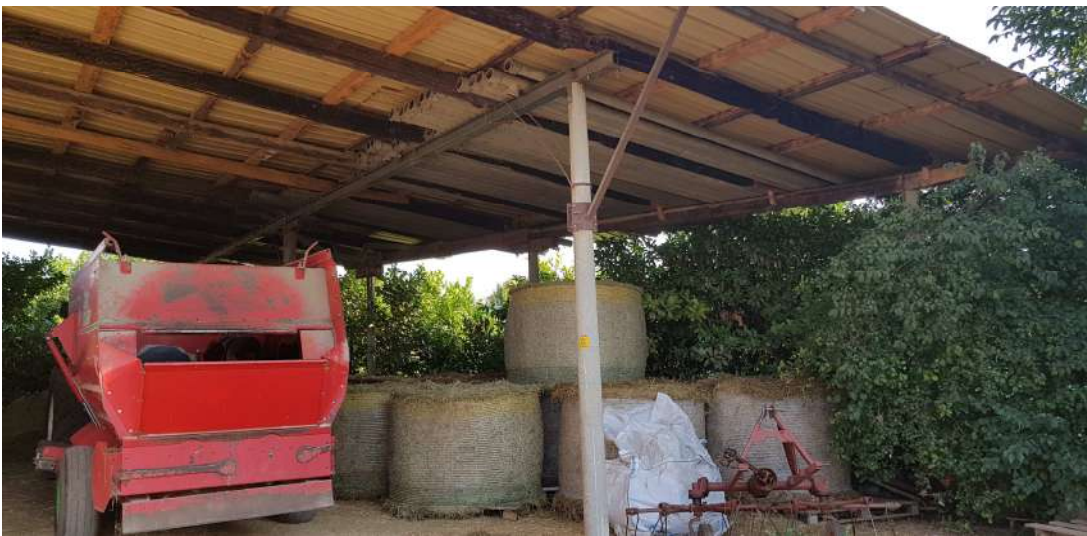
Fabbricato C - piano terra