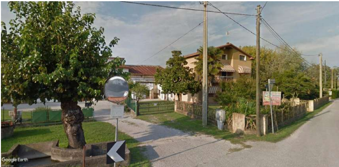
Ingresso secondario in comproprietà con terzi (mn 242)