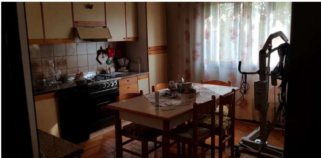
Fabbricato F - Piano primo - cucina abitazione residenziale