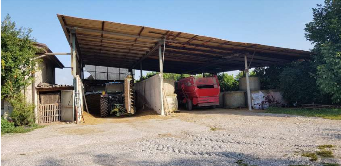
Fabbricato C - lato sud piano terra