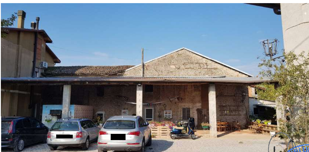
Fabbricato A - lato est abitazione residenziale