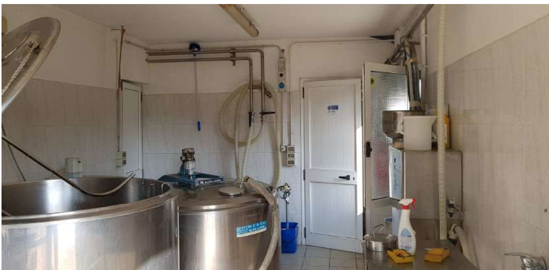
Fabbricato D - locali accessori lavorazione del latte