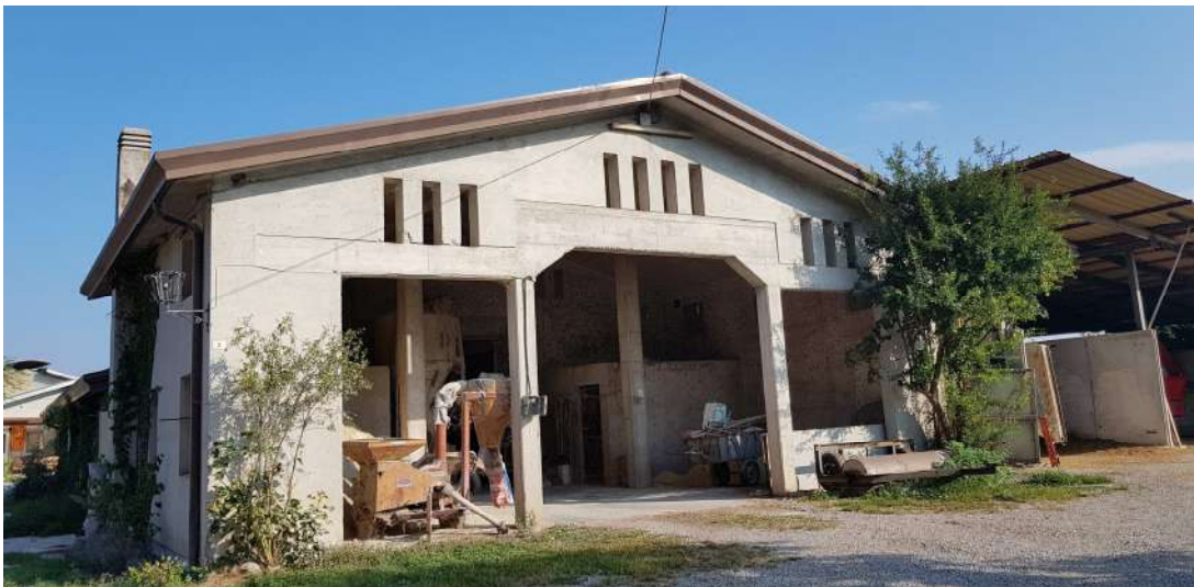
Fabbricato B - lato sud