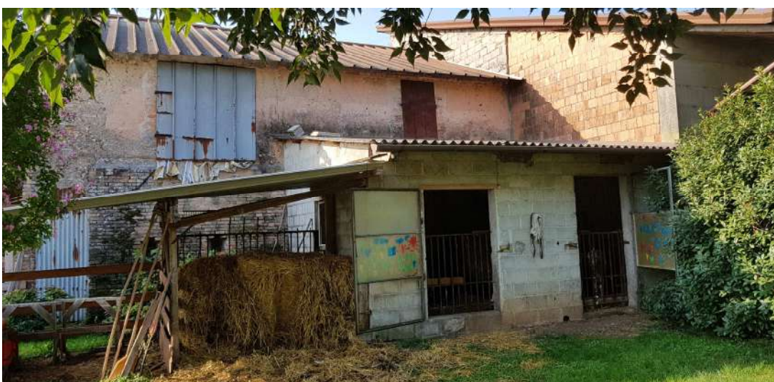
Fabbricato A - lato nord abitazione residenziale