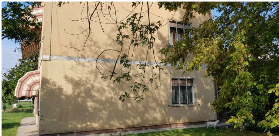
Fabbricato F - Lato ovest abitazione residenziale