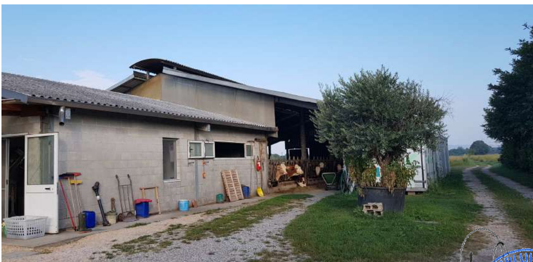
Fabbricato D - stalla e locali accessori per lavorazioni accessorie lato est

Geom. PIERLUIGI SARTOR Albo Geometri Prov. Treviso N° 3049 Trevignano