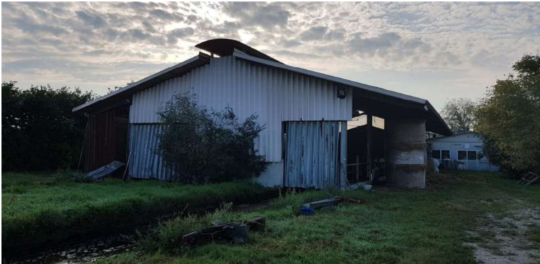
Fabbricato D - stalla lato nord