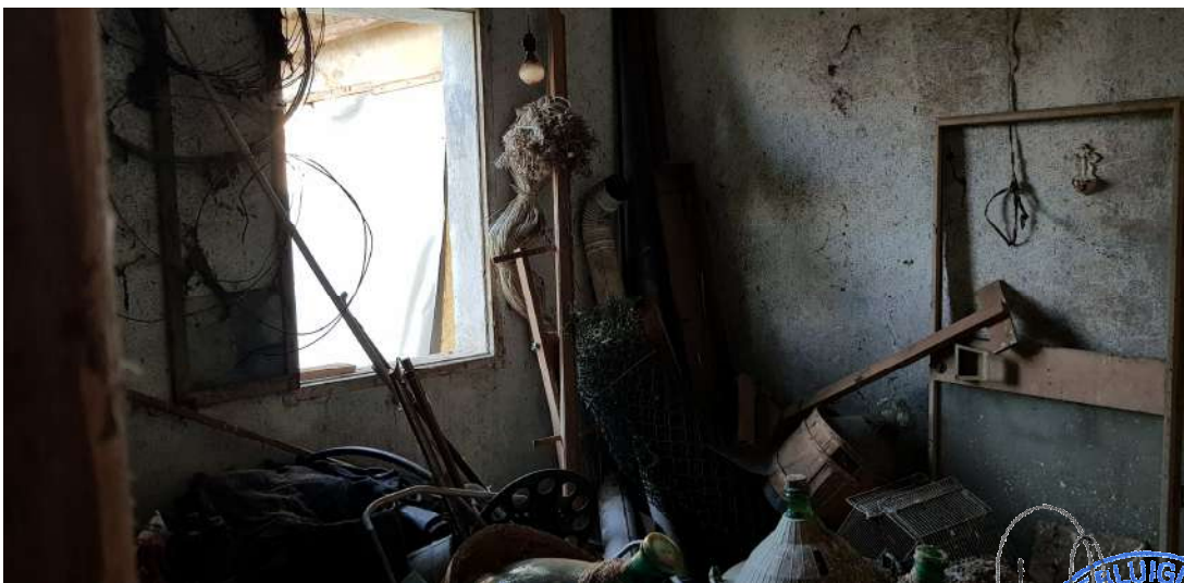
Fabbricato A - piano primo

Geom. PIETRUCCI SARTOR Albo Geometri Prov. Treviso N° 3049 Trevignano