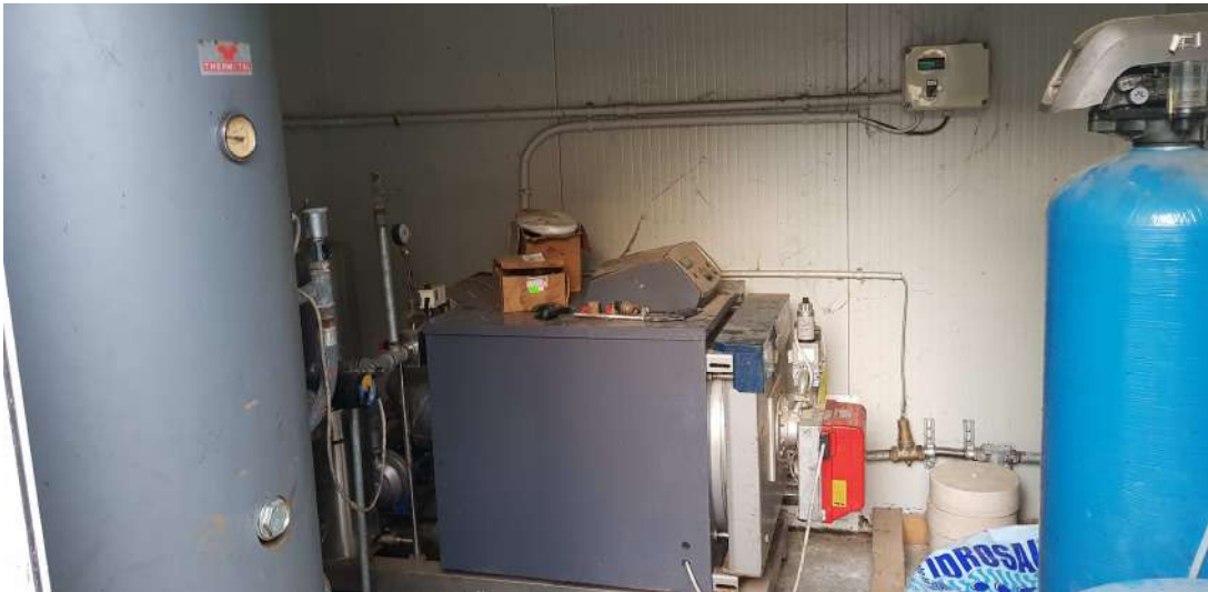
Fabbricato D - minicaseificio centrale termica