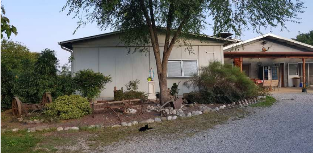
Fabbricato D - minicaseificio lato sud