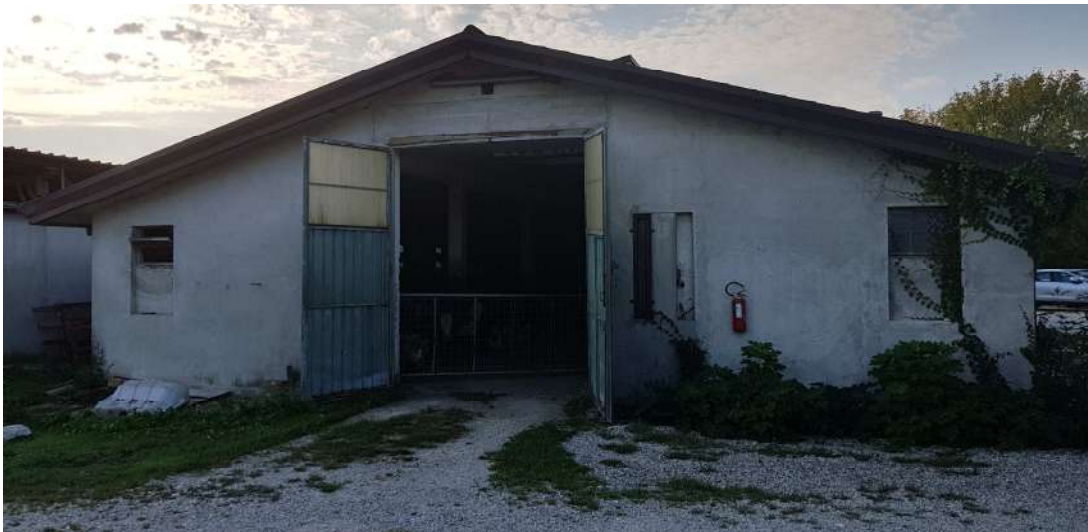
Fabbricato B - lato nord