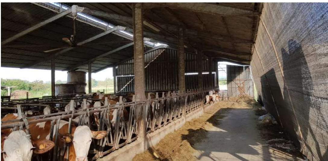
Fabbricato D - stalla piano terra