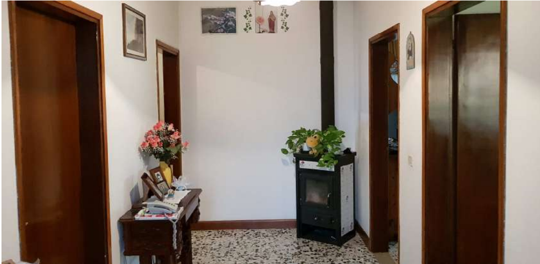
Fabbricato F - Piano terra - ingresso abitazione residenziale