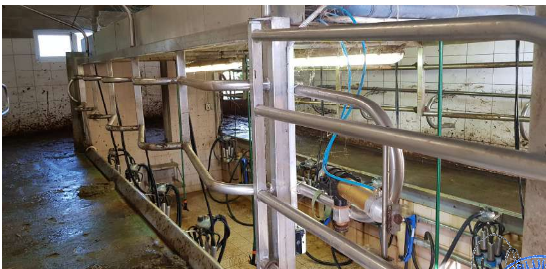
Fabbricato D - locali accessori mungitura