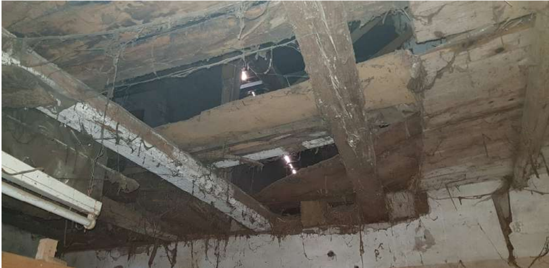
Fabbricato A - piano terra