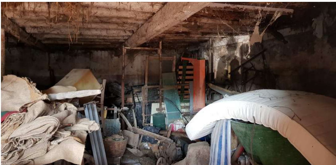
Fabbricato A - piano terra