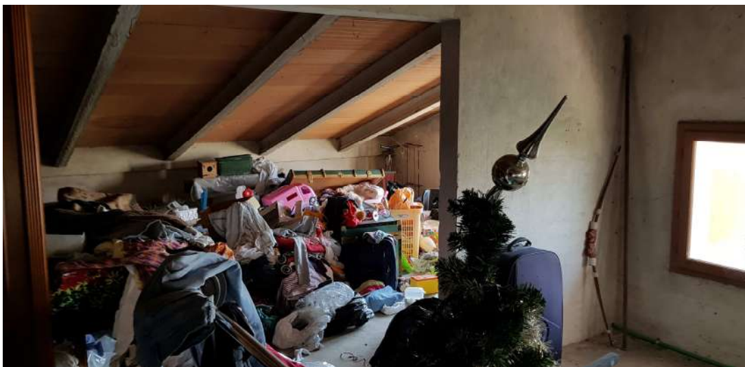
Fabbricato F - Piano secondo - soffitta abitazione residenziale