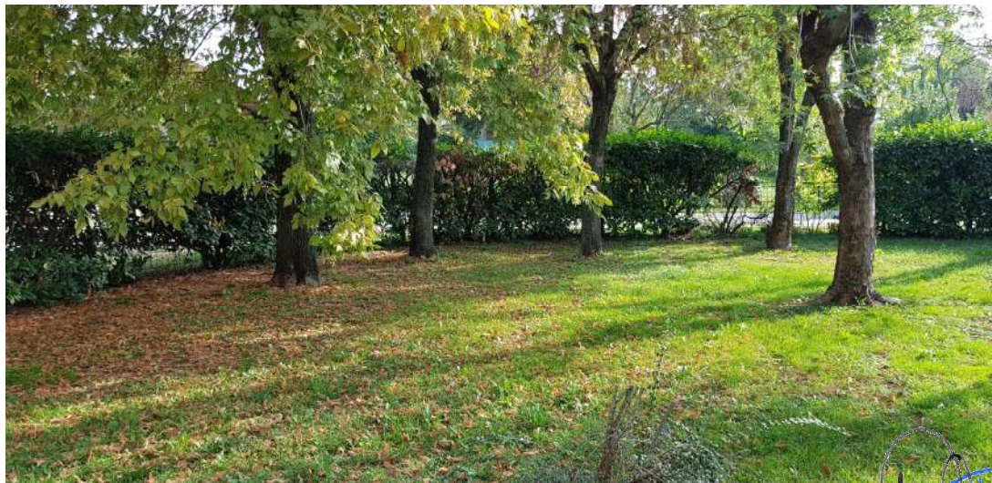
Fabbricato F - Giardino - corte esclusiva abitazione residenziale