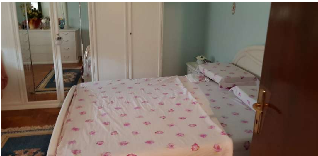
Fabbricato F - Piano terra - camera abitazione residenziale