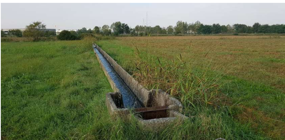
Terreni agricoli con a destra canale demaniale a cielo aperto