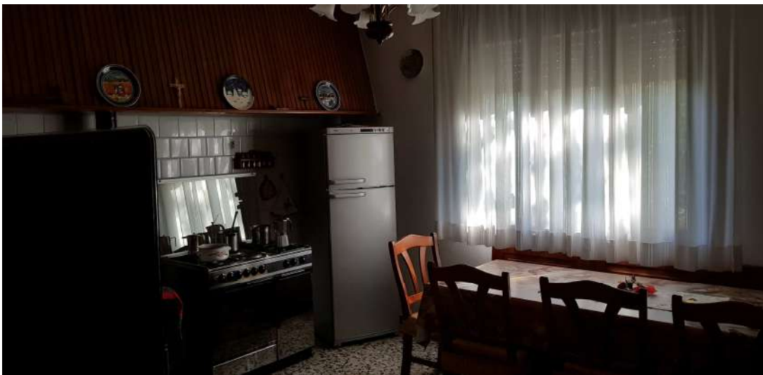
Fabbricato F - Piano terra - cucina pranzo abitazione residenziale