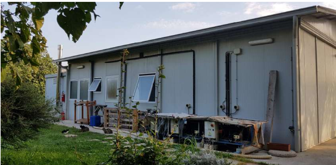
Fabbricato D - minicaseificio lato ovest