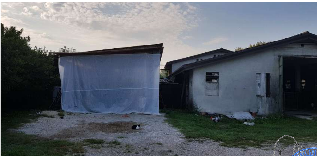
Fabbricato C - lato nord

Geom. PIERLUIGI SARTOR Albo Geometri Prov. Treviso N° 3049 Treviso