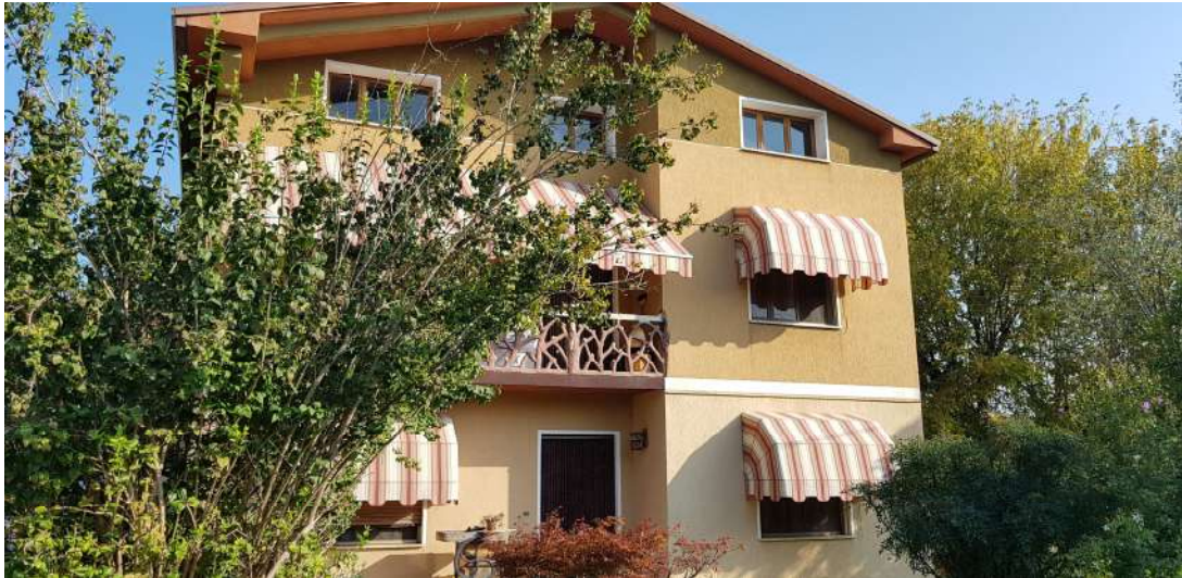
Fabbricato F - Lato sud abitazione residenziale