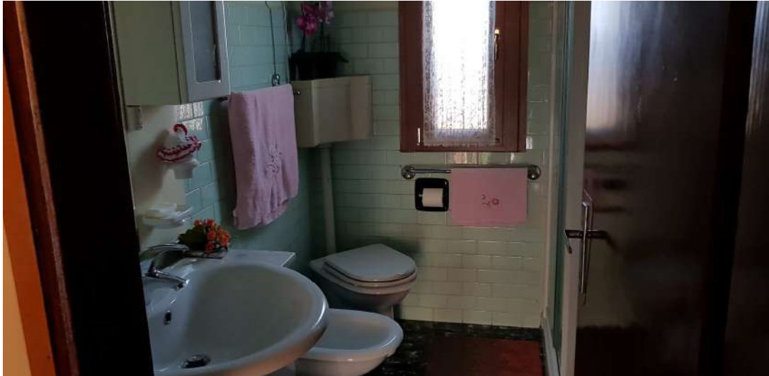
Fabbricato F - Piano primo - bagno abitazione residenziale