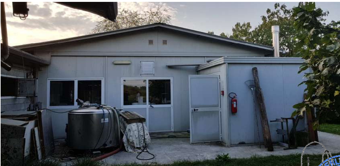
Fabbricato D - minicaseificio lato nord