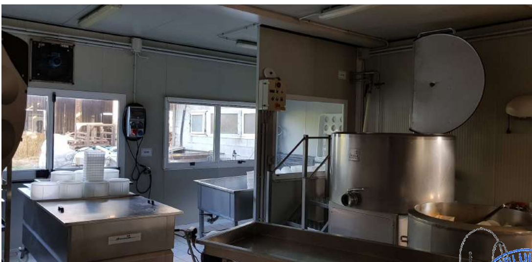
Fabbricato D - minicaseificio piano terra