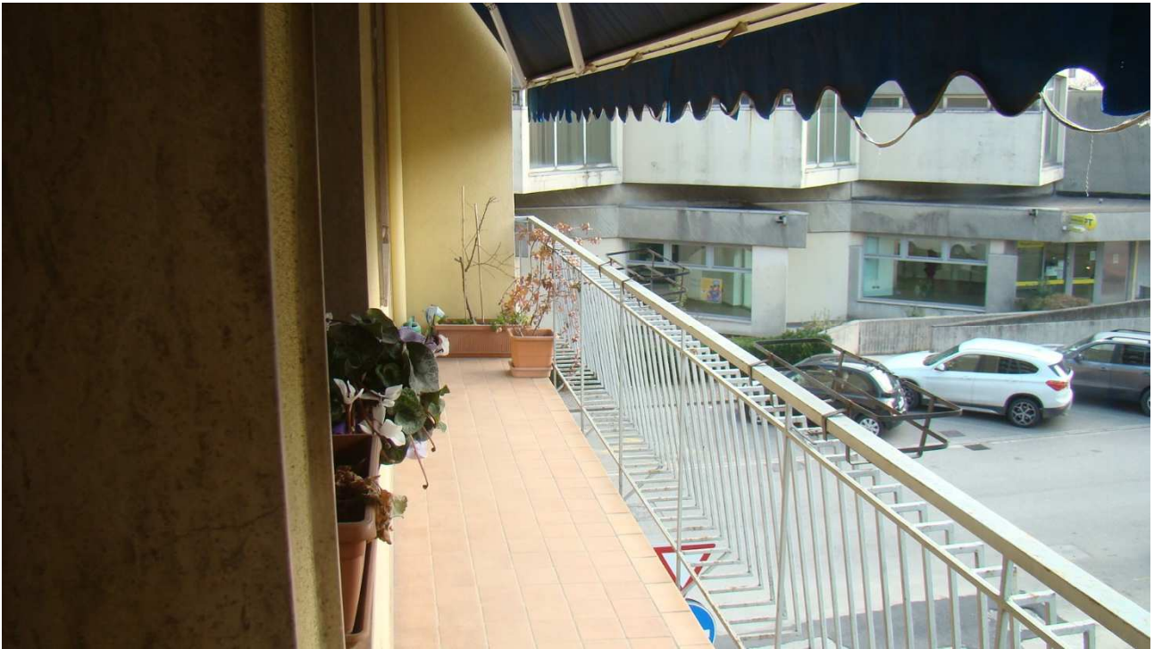
Fotografia 16: la terrazza sul fronte sud