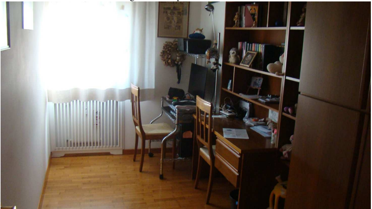
Fotografia 13: lo studio