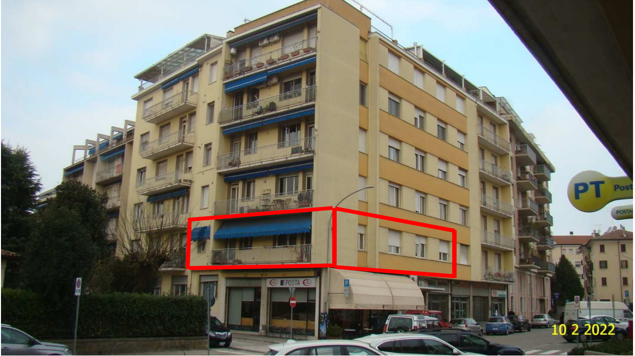
Fotografia 1: il condominio Cadore, visto da sud-est