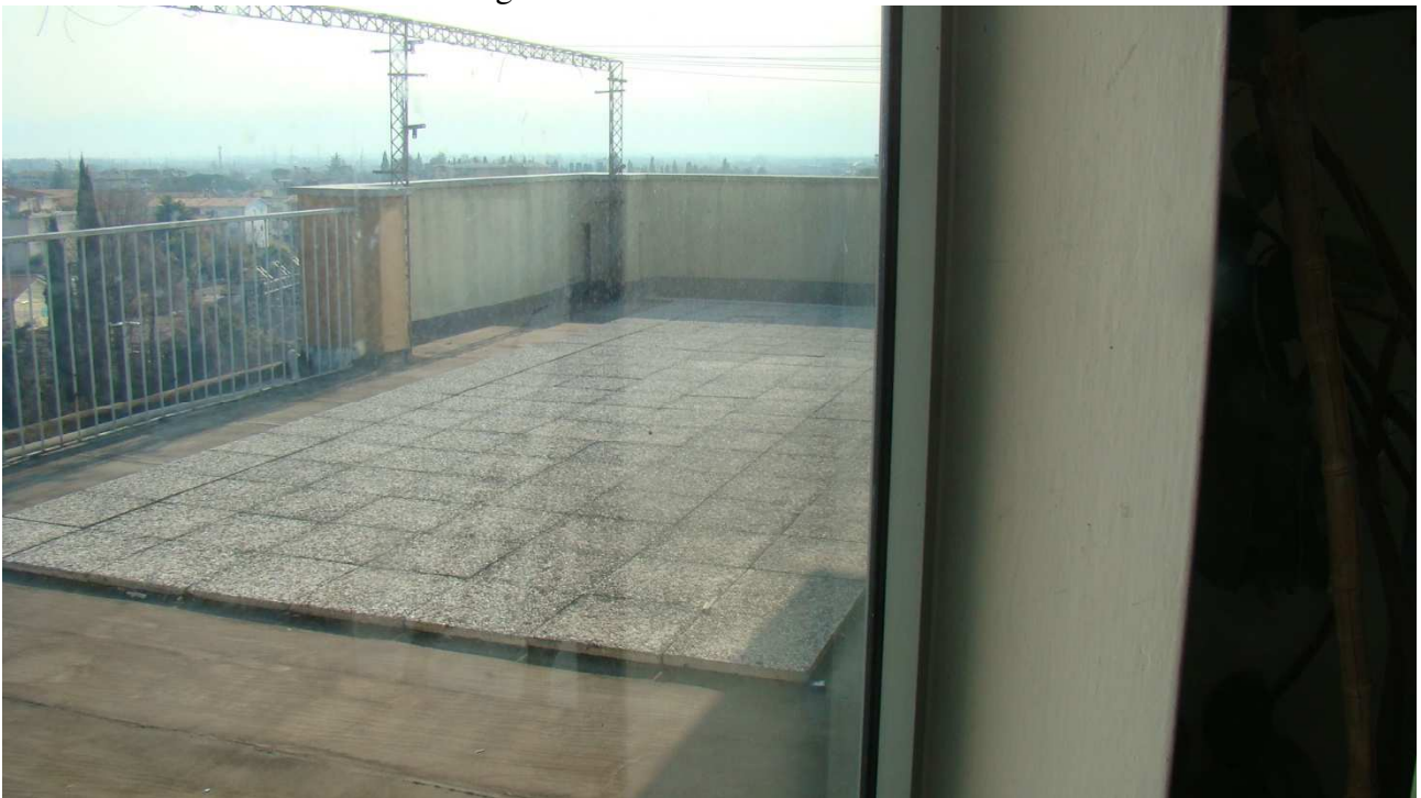
Fotografia 17: lo stenditoio comune