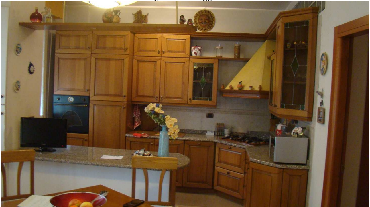
Fotografia 9: il pranzo-soggiorno