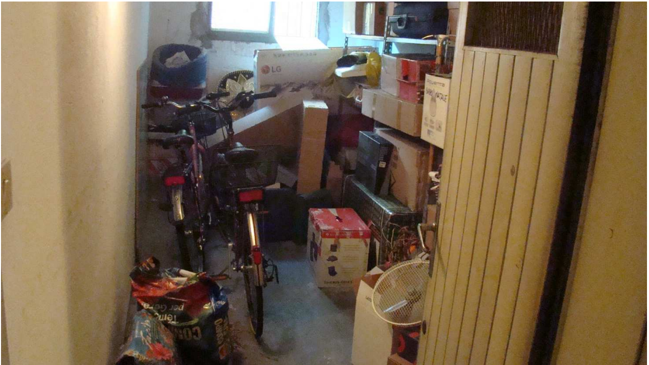
Fotografia 18: il cantinato al piano interrato