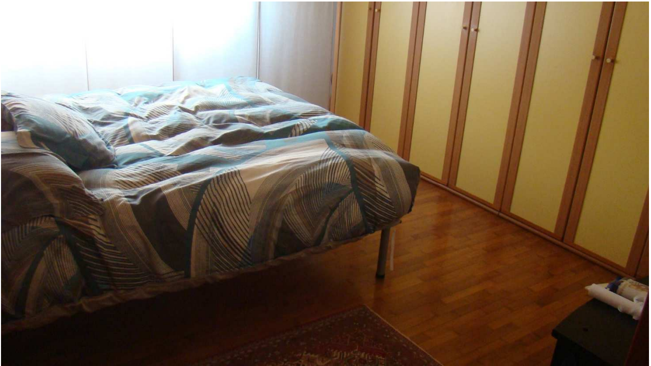
Fotografia 12: la prima camera a destra