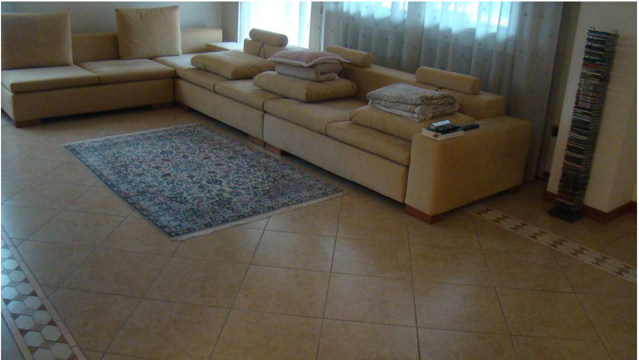
Fotografia 8: il soggiorno