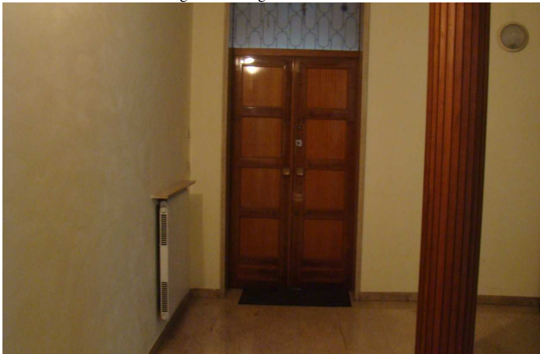
Fotografia 5: il portone d'ingresso all'appartamento al piano primo