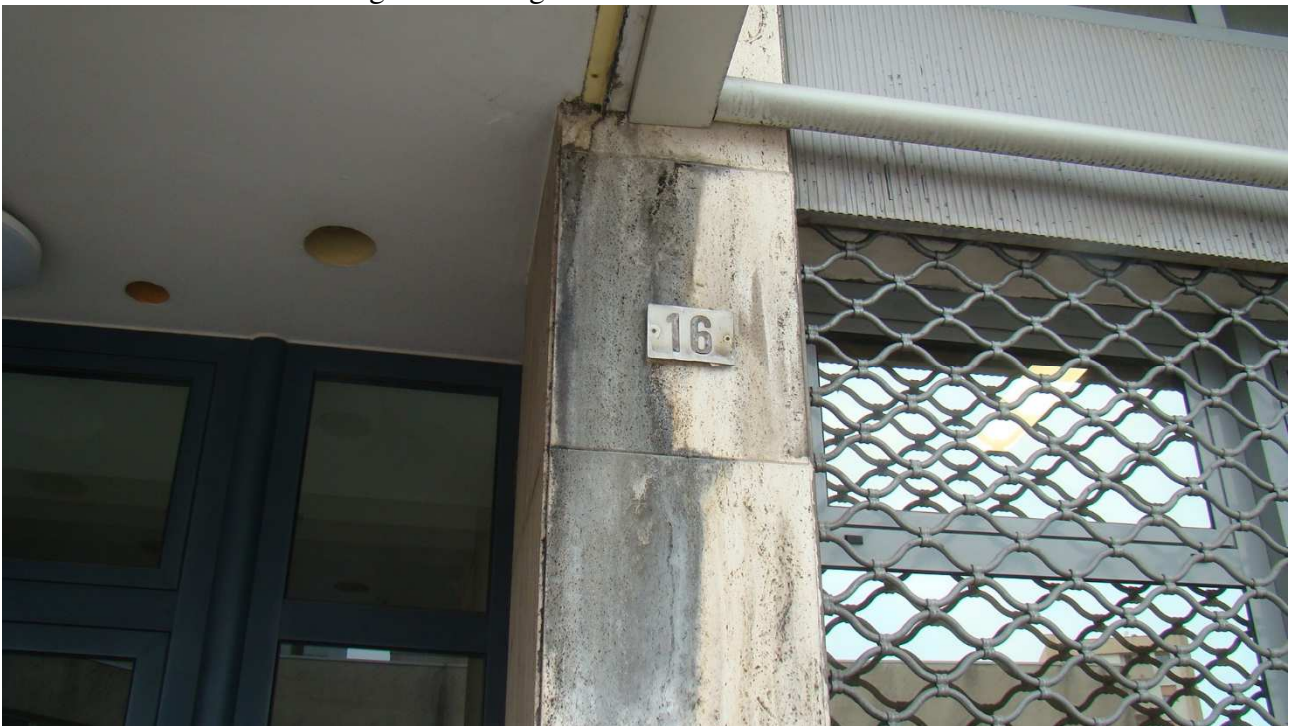
Fotografia 3: il numero civico del condominio