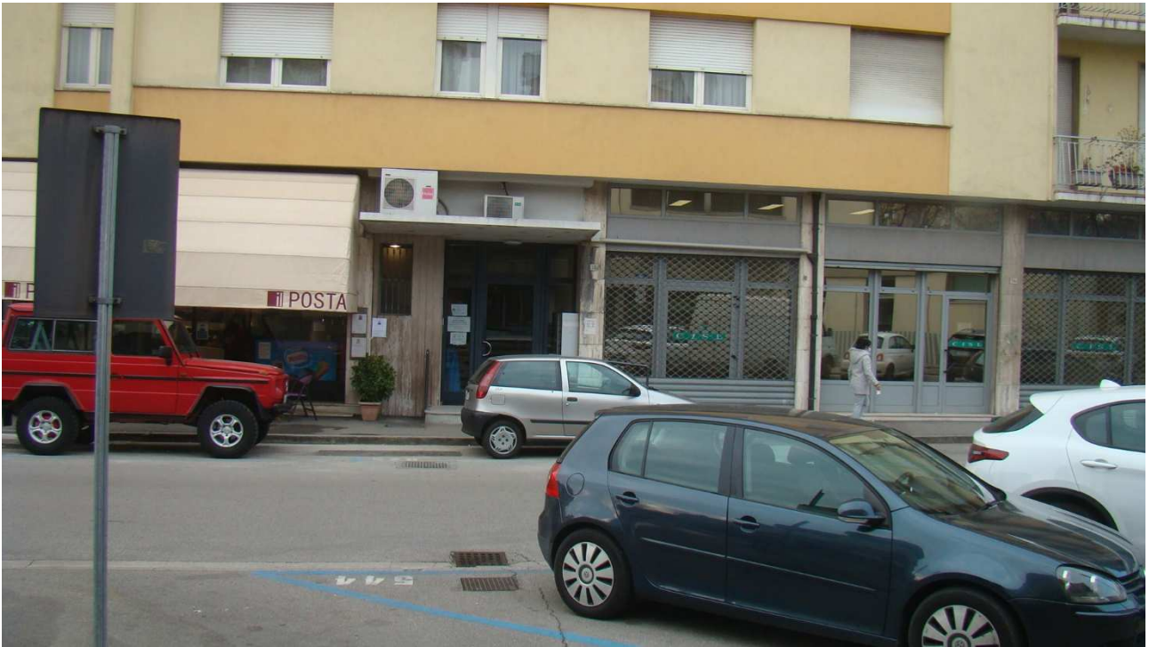
Fotografia 2: l'ingresso al condominio dal fronte est