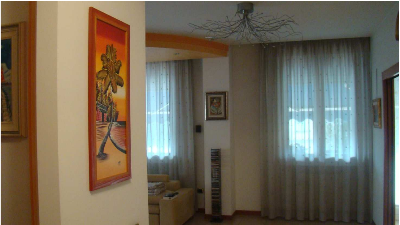
Fotografia 6: la zona d'ingresso all'appartamento