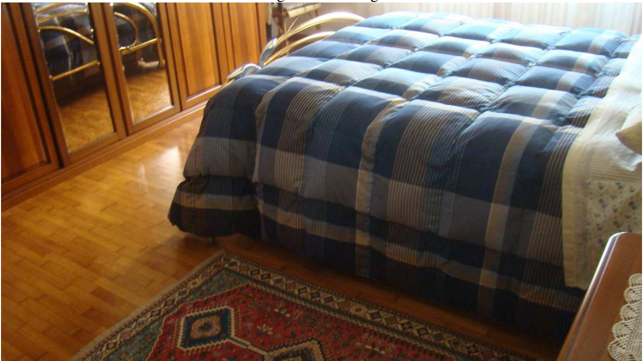
Fotografia 15: la seconda camera in fondo al corridoio