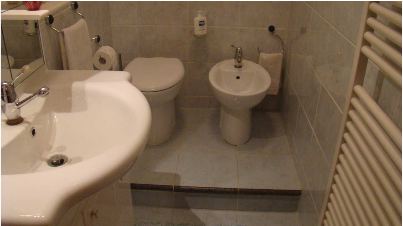
Fotografia 10: il WC