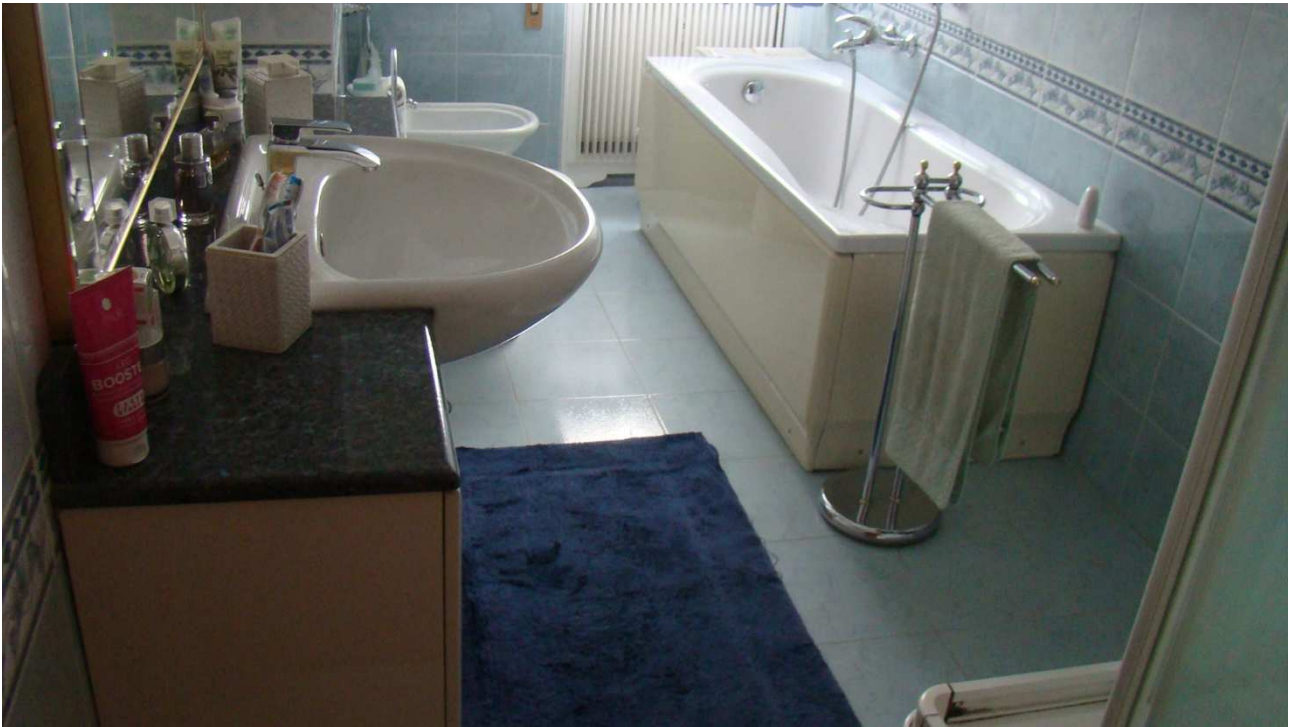
Fotografia 14: il bagno