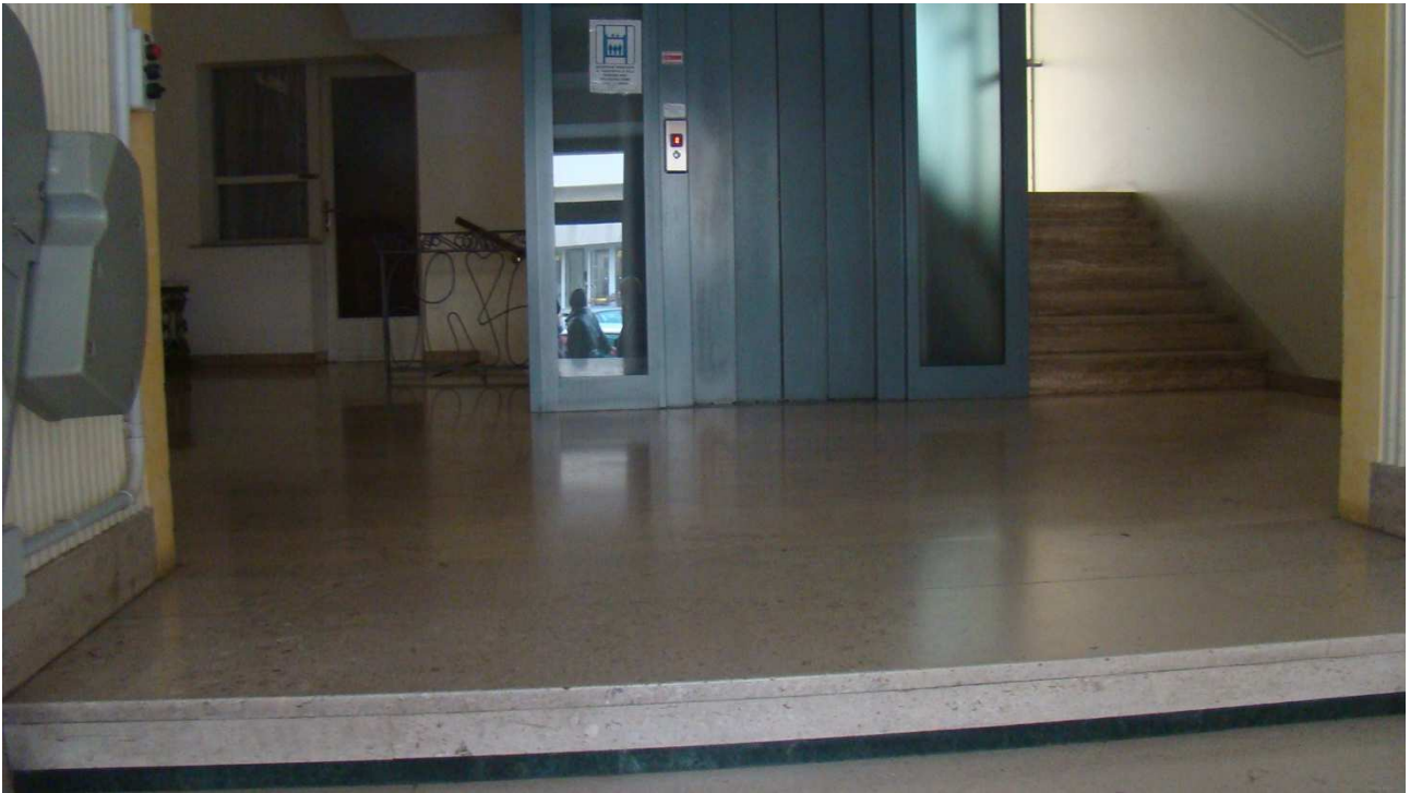
Fotografia 4: l'ingresso al condominio